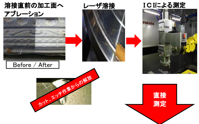
測定結果 グラフにより数値化